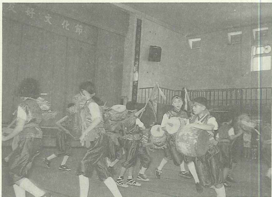
跳鼓活動有助於小朋友對傳統技藝的認識

傳統的農業社會，每逢地方上廟會節慶或進香活動都會有陣頭出陣遊行表演，在各種陣頭的表演中多以活潑趣味為主，跳鼓陣是這些趣味陣頭中頗為重要的一種。跳鼓陣的起源，相傳是明朝末年國姓爺鄭成功在收復台灣後，矢志反清復明，於是召集各地英雄好漢舉行比武大賽，在比賽的時候由人在旁邊擊鼓吶喊，這有點類似於我們今天比賽時啦啦隊性質的戰鼓，實為今日跳鼓陣之濫觴。明鄭失敗，清朝佔領台灣後，這些英雄好漢散居在各地開墾種田，農閒時，很多人仍不忘當年加油的戰鼓，於是有人將它改變成花鼓的形式，隨著歲月的變遷而成為現在的跳鼓陣。