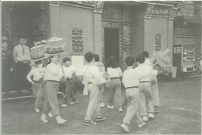
跳鼓隊在農業社會中常配合節慶活動演出

抱持著文化傳承的使命，鄧公國小於民國八十一年九月成立跳鼓隊，期間經過所有老師的耐心指導及各界先進賜教，始初具規模。本年度更擴大招收新隊員，希望能使傳統